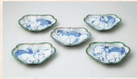
いろえぐん ぼんもんへんげいざら 佐賀県重要文化財 色絵群馬文変形皿 鍋島焼(有田 岩谷川内窯) 江戸時代・1650年代頃 佐賀県立九州陶磁文化館(白雨コレクション)