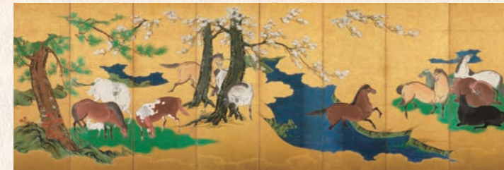
ぼくぼ 牧馬図屏風 狩野孝信 桃山時代~江戸時代初期・16世紀後期~17世紀初期 個人蔵