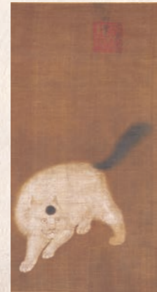
じゆこうねこ 麝香猫図 宣宗 明・宣徳元年(1426) 個人蔵