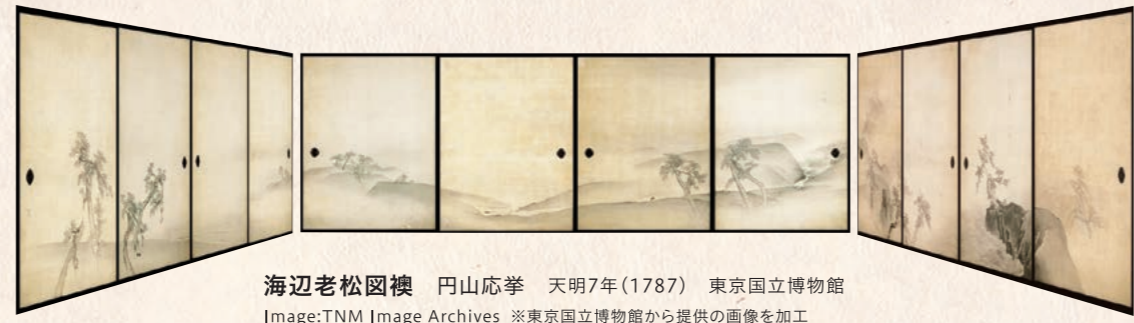
海辺老松図襖 円山応挙 天明7年(1787) 東京国立博物館

明治23年9月、神戸布引に開館。大正13年(1924)の第14回の展覧まで活動していました。公開は年に数日で、入館できるのは川崎美術館から送付された縦覧券を持つ招待客のみでした。美術館の室内には、現在東京国立博物館に所蔵されている円山応挙の襖絵が飾られていました。本展では、円山応挙の襖絵を用いて、美術館の一部の空間の再現展示も行います。