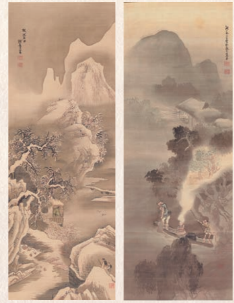
あんなや せつらいさんすい よきぶそん 闇夜漁舟図・雪景山水図 与謝蕪村 江戸時代・18世紀後期 公益財団法人阪急文化財団 逸翁美術館