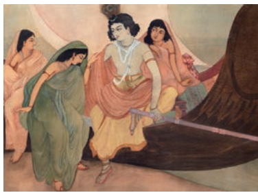
ナンダラル・ボース「舟遊び(クリシュナとラーダ)」 （ニューデリー国立近代美術館蔵）

日印国交樹立70周年を記念し、インド近代絵画の開拓者で日本とも交流のあった、ナンダラル・ボースとウベンドラ・マハラティの作品25件を展示。