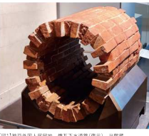
【図1】神戸外国人居留地 煉瓦下水管(復元) 当館蔵

明治5年(1872)に竣工した旧神戸外国人居留地の煉瓦造排水下水管です。【図1】南厚田の砂地に立地する居留地では、計画当初雨水の排水が懸念されていたため、当初から下水管が敷設が予定されました。明治5年に「W.ハート」が作成した「神戸外国人居留地計画図」には下水管の埋設位置が示されています。実際に京町筋や東町筋、明石町筋では発掘調査などで明形下水管が確認されています。