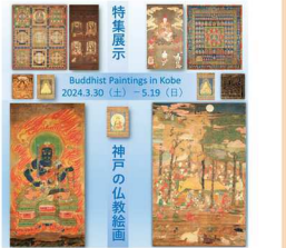
「Buddhist Paintings in Kobe 2024.3.30(土)～5.19(日) ◎コレクション展示室の観覧までご覧いただけます。」

博物館が預かりしている仏教絵画をみなさんにご紹介します。大宇宙の象徴・曼荼羅の神秘に寄り添う、迫力満点の不動明王と二人の童子。霞たなびく深山山嶺を往來とす、修験道の開祖・役小角とおつき子の鬼たち。霊地高野山を守護する神々の姿。過去、現在、未来の宇宙に息づく、全ての罪を赦してくれる、慈悲の仏たち。2500年前に起こった。私たちの先祖の「永遠の安らぎの世界」への願がなげ立ち…。異国情緒あふれる旧居留地。近代以前の異世界巡りをお楽しみください！素敵な道先案内人に見えるかも？！