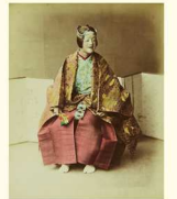
「『(婦人像)』(透視) 明治時代

当時、手彩色写真は格好の土産物として外人の興味をひきつけ、日本の有力な輸出品の一つとなりました。写真に収められた風光明媚な名所や珍しい風景は、現代日本に生きる私たちにとっても、幕末・明治の日本という遠く時間を隔たった世界への好奇心を喚起するものです。また、私たちはこれらの写真を通して、当時の外国人が日本の何に興味関心を持ち、それらを写真という形で手元に留め、なぜお土産として本国へ持ち帰ったのかを知るすることができます。