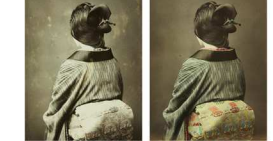
「『女性の像』(透視) 明治時代 ビエール・セルネ氏蔵

これらの写真はしばしば、1点1点精緻に彩色され、カラー写真のような「手彩色写真」に仕上げられて、豪華な装綴紙のアルバムに綴じ込まれました。