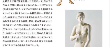
「(彫りのヴィーナス(ヴェニス・プディカ)) 1世紀 ナポリ国立考古学博物館蔵

人類史上に輝く輝きを誇った古代ローマ。なかでも日本人が深い関心をよせるものの一つがテルマエ(公共浴場)であり、ヤマザキマリ氏による漫画「テルマエ・ロマエ」はテルマエへの親近感を一層高めました。本展では、テルマエを愛した古代ローマの人々の生活を今に伝える絵画、彫刻、考古遺物といった100件以上の作品が国内外から集まりました。また、「テルマエ・ロマエ」の主人公ルゥスが案内人となり、古代ローマのテルマエとともに、日本の入浴文化も紹介します。ルゥスが浴場をおとしてローマと日本を往復するように、それぞれの入浴文化を体験することのできる機会となるでしょう。