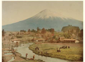
「日下部金兵衛 カタログ」(透視) 日下部金兵衛 明治時代中期 当館蔵

日本の開国後、幕末から明治時代にかけて、これまで交流のなかった諸外国の人々が来日するようになりました。彼らの需要に応じて、フェリー・チェ・ペアート、ライムント・フォン・シュティルプリーツ、日井秀三郎、日下部金兵衛、アドルフ・ファルサーリ、五村康三郎らの写真館では、日本の名所や風俗を撮影した写真を販売しました。