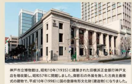
神戸市立博物館は、昭和10年(1935)に建築された旧横浜正金銀行神戶支店を改装し、昭和57年(1982)に国の登録有形文化財(建造物)になりました。

利用案内 開館時間：午前9時30分～午後5時30分(入館は午後5時まで) ※特別展開催時の金・土曜日には午後7時30分まで開館(入館は午後7時まで) 休館日：毎週月曜日(ただし、月曜日が祝日または休日の場合は翌日・翌平日に休館) ※年末年始のほか、祭礼休日の当日に休館及び閉館することがあります。祭礼日の拡大のため、展覧会の延期・中止、ならびに開演事業の中止をさせていただきます。ご留意ください。 詳細はホームページが、博物館までお問い合わせください。