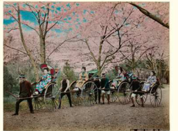
「2049「CHERRY BLOSSOMS AND JIRIKISHAS」(透視) 日下部金兵衛 明治時代中期一前期 東京都写真美術館蔵

被写体の選定、巧みな構図と美しい色彩は、現実の日本そのものではなく、東洋の神秘「JAPAN」のイメージを作り上げていきます。