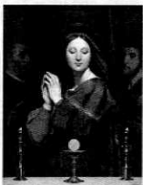
ジャン=オーギュスト= ドミニク・アングル 「聖杯の前の聖母」