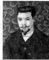
フィンセント・ ファン・ゴッホ 「医師レーの肖像」