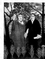
アンリ・マティス 「カラー、アイリス、ミモザ」