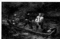
ウジェーヌ・ドラクロワ 「難破して」